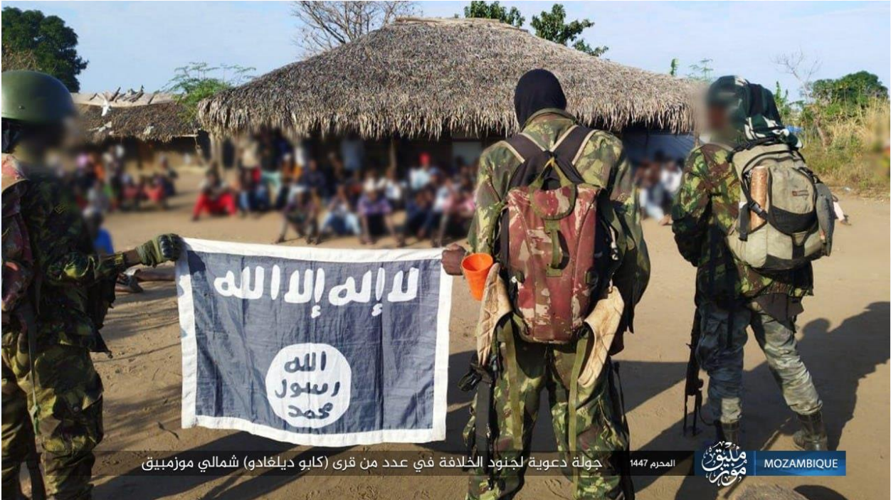
جولة دعوية لجنود الخلافة في عدد من قرى (كابو ديلغادو) شمالي موزمبيق

▪ مرفق: صورة نشرها التنظيم حول ما أسماه "الدعوة"